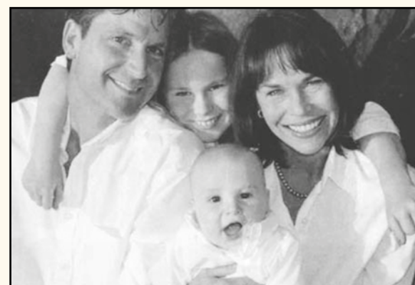
Sorrisi di gioia in famiglia.

più, gravi pensieri mi percorrono; come la madre bisbiglio al Signore la mia speranza quotidiana, interrogo Lui e la mia fede, sento dentro di me i dolori e le sofferenze altrui, al cui confronto i problemi miei e della mia famiglia non sono niente.