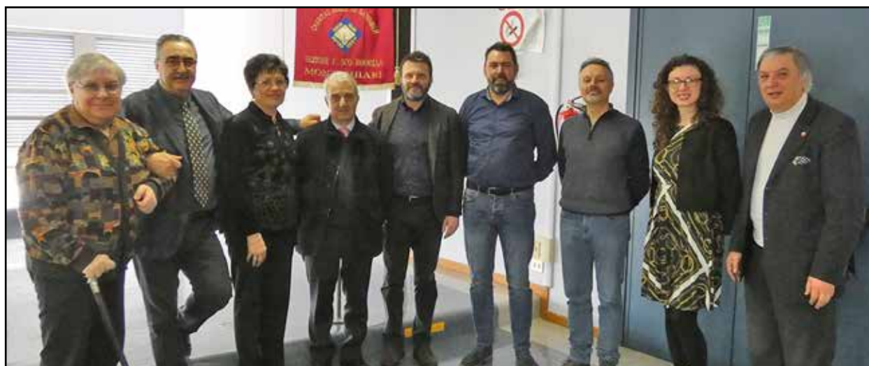
Dirigenti Avis con il Presidente dell'Aido.

Alcuni donatori hanno scelto di recarsi direttamente alla