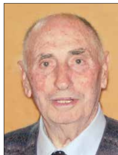
Natale Este 5° anniversario