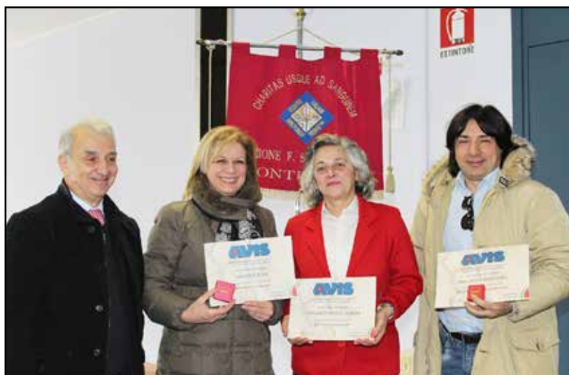
Il Presidente Policarpo con dei premiati.